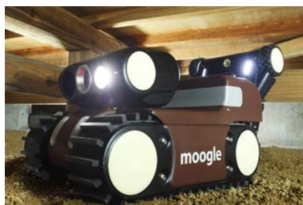
【床下点検ロボット「moogle」】