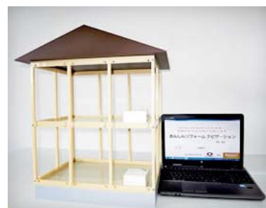
【簡易耐震診断測定器 「あんしんリフォームナビゲーション」】