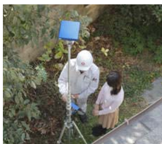
【屋根点検カメラ「たかみ君」】